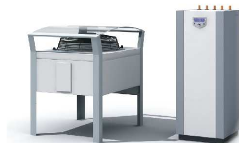
výkon 6 - 10 kw

Obsluha tepelného čerpadla je velmi jednoduchá díky technicky pokročilému, ale uživatelsky velmi přívětivému řídicímu systému. Elektronický řídicí systém speciálně vyvinutý pro tepelná čerpadla vzduch-voda na základě nejnovějších poznatků z výzkumu a reálného provozu, zajišťuje kromě automatického řízení tepelného čerpadla všechny potřebné funkce pro energeticky úsporný vytápěcí a chladicí systém, jako např. ekvitermní regulaci teploty, řízení topných okruhů, funkce pro ohřev teplé vody, časové programy, diagnostiku provozních stavů apod. Inteligentní systém odtávání venkovní jednotky zajišťuje spolehlivý chod čerpadla i v extrémních podmínkách a rovněž minimalizuje vlastní spotřebu energie.