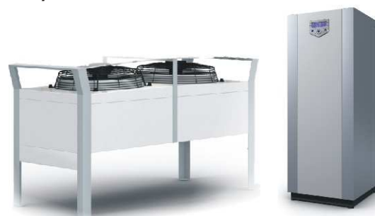
výkon 12 - 18 kw